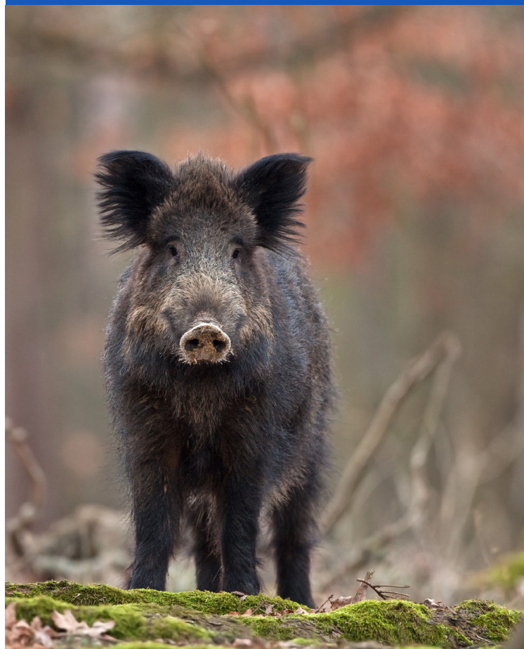
Volwassen wild zwijn